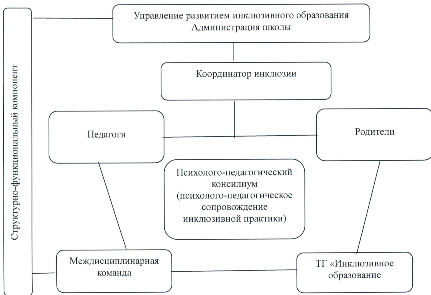
Рис. 1 – Структурно-функциональный компонент Модели инклюзивного образования МБОУ СШ № 17

Цель деятельности ППк - создание оптимальных условий обучения, развития, социализации и адаптации обучающихся посредством психолого-педагогического сопровождения.