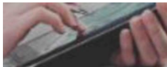
Рис. 1. – Баннер «Обучение по санитарно-просветительским программам - основы здорового питания»

Для процедуры регистрации необходимо нажать кнопку «Регистрация в ПС – обучение по программам основы здорового питания» (рис.2).