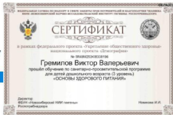
Рис. 15. – Просмотр результатов итогового тестирования и получение сертификата, подтверждающего успешность прохождения обучения

В случае если набрано менее 80% правильных ответов, Программа указывает проблемные разделы и предлагает пройти тестирование повторно. Количество повторных тестирований не ограничено по количеству, но ограничено по времени. Повторное тестирование можно пройти не ранее чем через 24 часа от предыдущего тестирования.